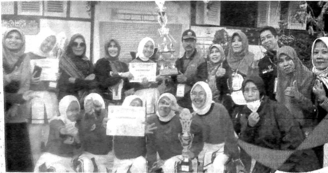
TERIMA TROPI- Tim senam SMKN 1 Padang Panjang menerima trofi lomba senam dalam rangka memeriahkan HUTRI ke-77.

Sementara Ketua Panitia, Bambang Prihmono menyampaikan, selain lomba senam, panitia juga akan menyelenggarakan kegiatan seminar antinarkoba untuk para mahasiswa dan juga seluruh generasi di Sumatera Barat. (205)