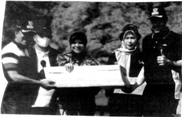
DOOR PRICE - Walikota dan Wakil Walikota Padang Panjang saat memberikan door price pada peserta yang beruntung.

Padang Panjang, Khazanah — rangkaian acara untuk memperingati Hari Kemerdekaan RI ke-77 di Kota Padang Panjang terus berlanjut. Hal tersebut terlihat saat pemko menggelar acara jalan sehat dan senam massal pada Minggu pagi (14/8) bertempat di Lapangan Khatib Sulaiman Bancah